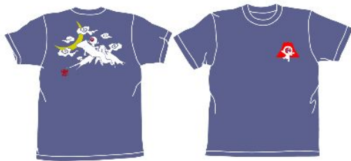
オリジナル目玉おやじTシャツ

新しいグッズの中で、オススメは、以下の商品です。（一部デザイン・価格等変更になる場合があります）