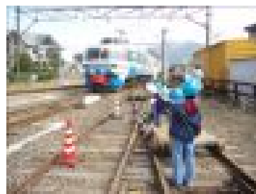
富士急行線に乗って親子鉄道教室