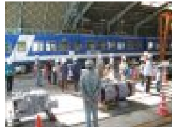
電車修理工場見学ツアー