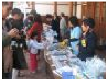
オリジナルグッズ販売