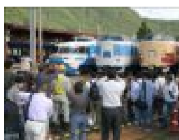
車両撮影会(イメージ)