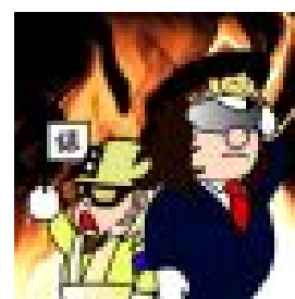
「スーパーベルズ」もやってくる！

富士急行株式会社(本社:山梨県富士吉田市、社長:堀内光一郎)では本年4月より実施しております富士急行線開業80周年を記念した各種イベント、キャンペーンのファイナルイベントとして、10月25日(日)に本年度で4回目となる「富士急電車まつり2009」を開催いたします。