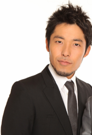
オリエンタルラジオ 中田敦彦