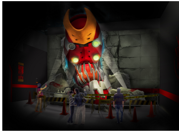
実物大エヴァンゲリオン2号機THE・BEAST（イメージ）