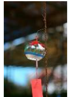
風鈴ビンゴラリー