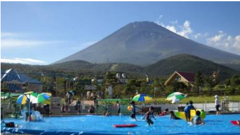
水遊び「アメンボ広場」

水遊び・雪遊びや自然観察、震災復興支援など、 “天然の涼しさ”の中で楽しめるイベントが盛りだくさん