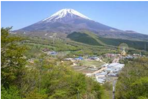
自然観察イベント（「黒塚」からの眺め）