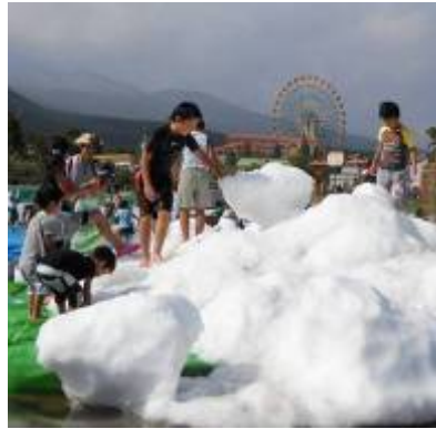
真夏の雪遊び広場