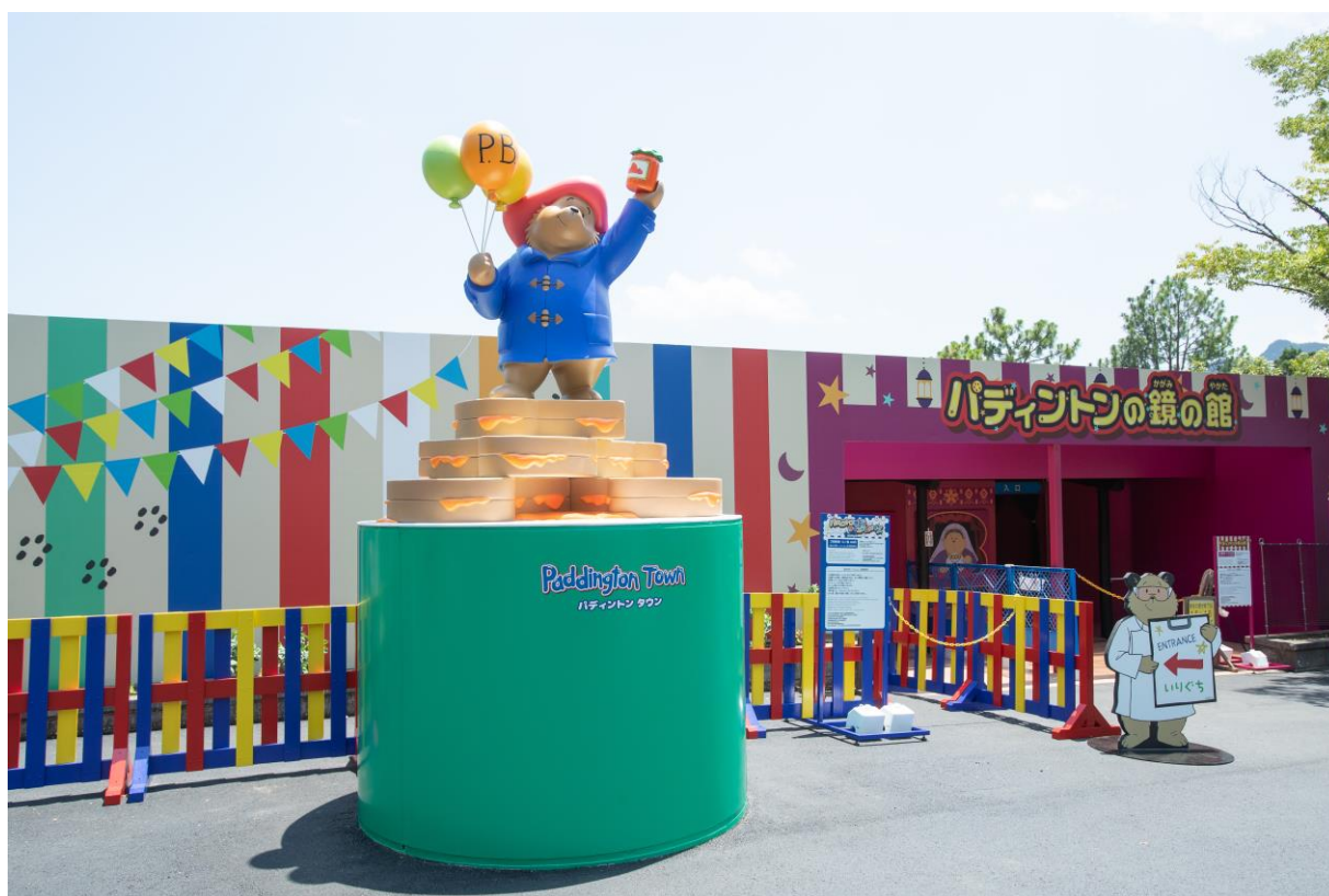
▲パディントン タウン入口前 メインモニュメント