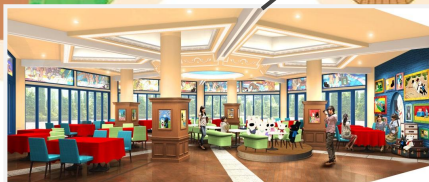
⑦リサとガスパール レストラン