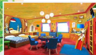
⑥リサルーン&ガスパールルーム