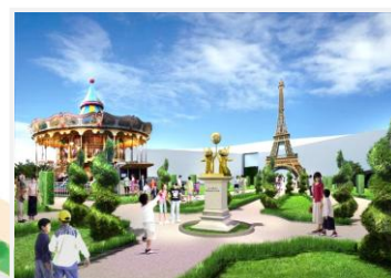
①エッフェル塔の広場