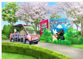
②リサとガスパールのパリカート