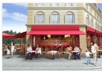
⑤BOULANGERIE CAFÉ Le Mont Fuji