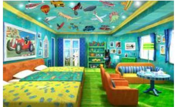
ガスパールルーム