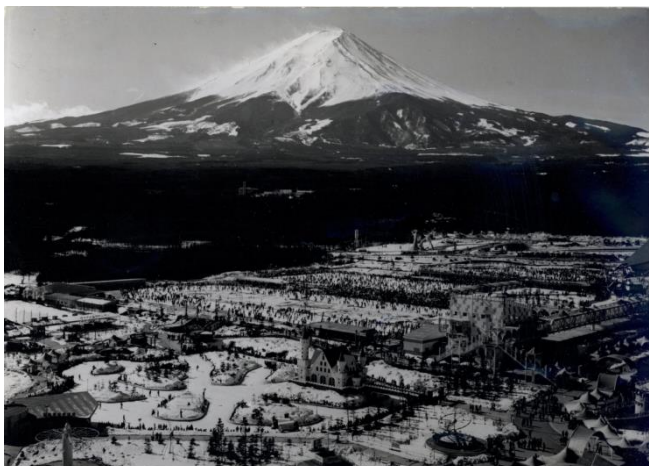
昭和46年（1971年）頃のスケートを楽しむ入園者で賑わう富士急ハイランド

【富士急ハイランドの歴史】 https://www.fujiq.jp/entertainment/history.html