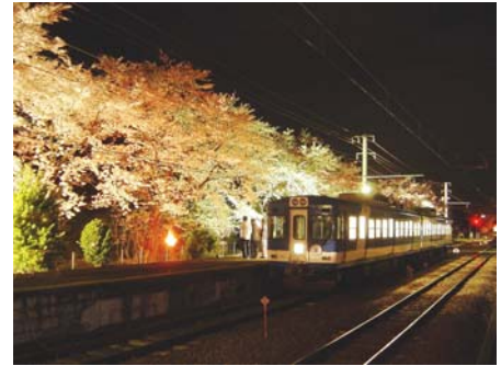
※東桂駅 夜桜ライトアップの様子

http://www.fujikyu-railway.jp/sakura2017/