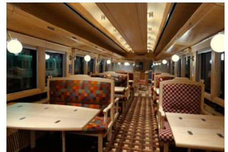
※贅沢プランの車内イメージ