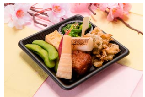
※お手軽プランのおつまみ(イメージ)