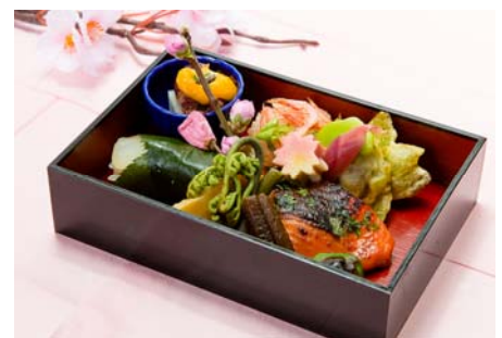
※贅沢プランのおつまみ(イメージ)