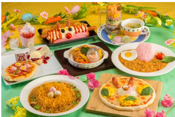
富士急ハイランド

また、隣接する「ハイランドリゾート ホテル&スパ」の「フジヤマテラス」では、人気のブッフェにイースターにちなんだ卵料理が登場します。