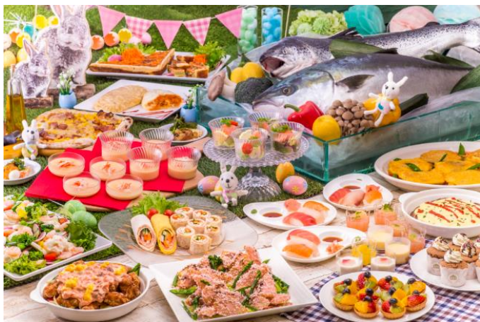
ハイランドリゾート ホテル&スパ 「フジヤマテラス」