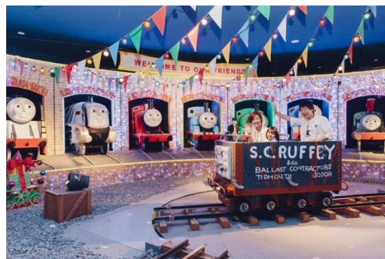
トーマスのパーティーパレード