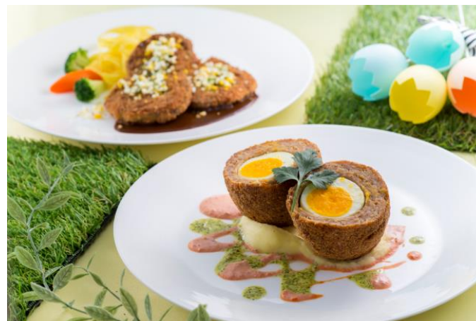
ハイランドリゾート ホテル&スパ 「リサとガスパールレストラン」