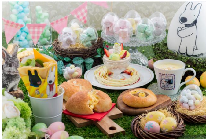
リサとガスパール タウン