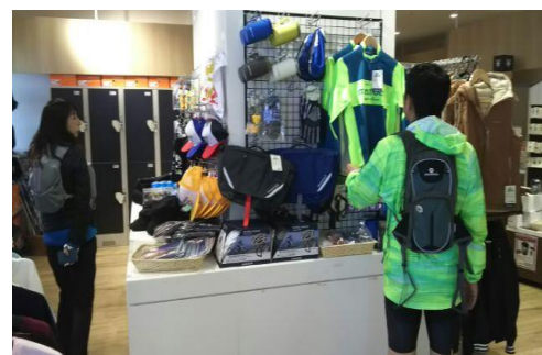
自転車関連グッズ