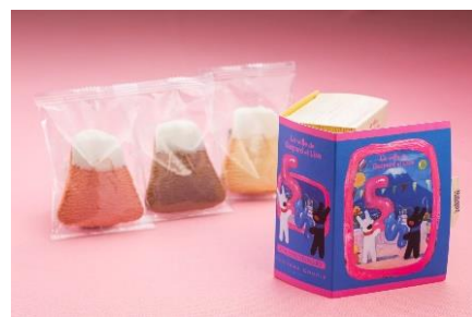
フジヤマクッキー BOOK 型限定パッケージ 550円