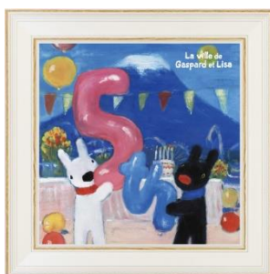
アートフレーム 2,160円

リサとガスパールが5周年をお祝いしている記念原画デザインの、アートフレーム、バンダナなど、リサとガスパール タウンでしか買えないオリジナルグッズが続々と登場します。