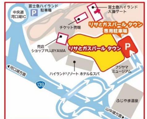
リサとガスパール タウン専用駐車場のご案内

リサとガスパール タウンに隣接する駐車場がございます。タウン内のお買い物金額に応じて、最大4時間無料でご利用いただけます。