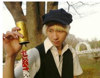
炎と光のパフォーマンス