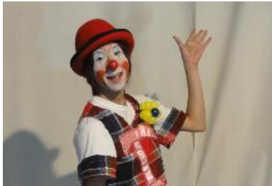
パルーンパフォーマンス