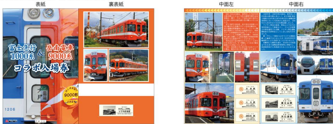
富士急行1000系&岳南電車9000系コラボ入場券セット 1,000円(税込)※予定