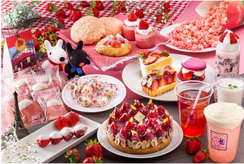
※「ストロベリーフェスタ」イメージ