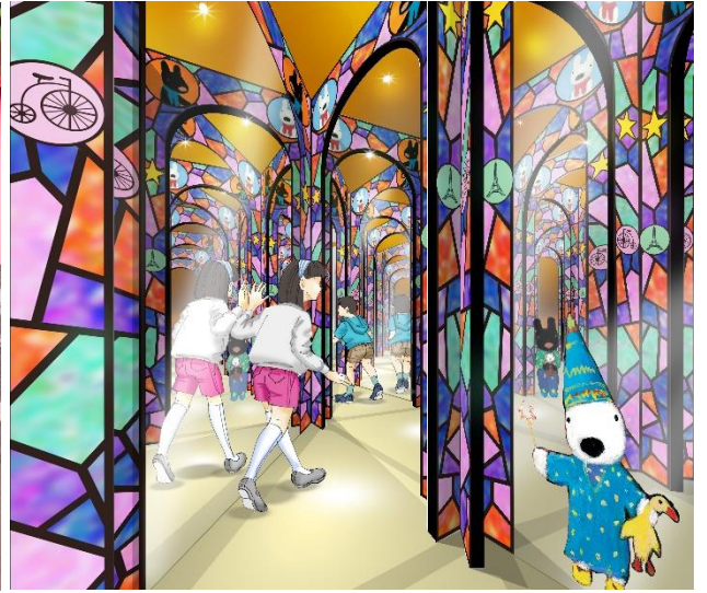
※「リサとガスパールのミラーメイズ」イメージ

昨年より入園無料となった富士急ハイランド(山梨県富士吉田市)にある「リサとガスパール タウン」では、2月25日(月)～4月19日(金)までの期間、今が旬のいちごをテーマにしたイベント「ストロベリーフェスタ」を開催いたします。