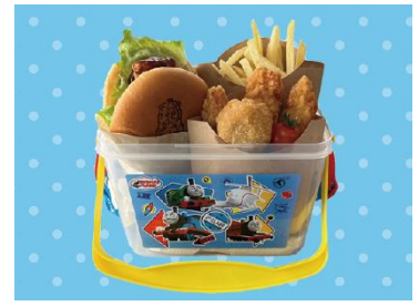
トーマスランド 25周年フィナーレ！ スペシャルピクニックボックス 2,400円 <トップハム・ハット卿夫人のおやつ屋さん>