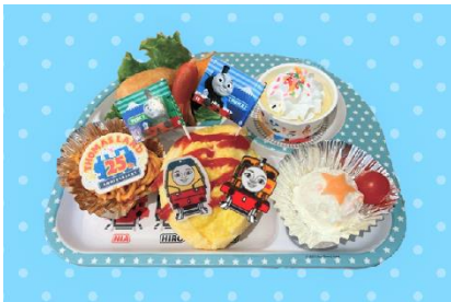
全員集合！25周年フィナーレプレート 2,000円 <トーマスレストラン>