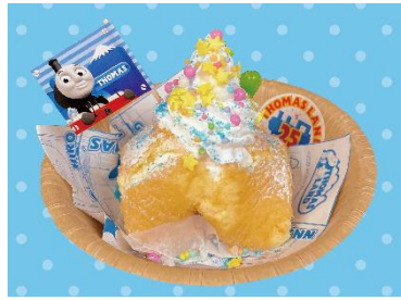
カインドリー婦人の手包みポップケーキ 680円 <カインドリー婦人のキッチン>