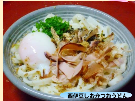
西伊豆しおかつうどん