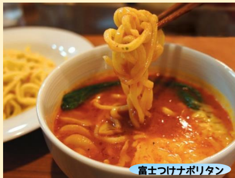
富士つけナポリタン