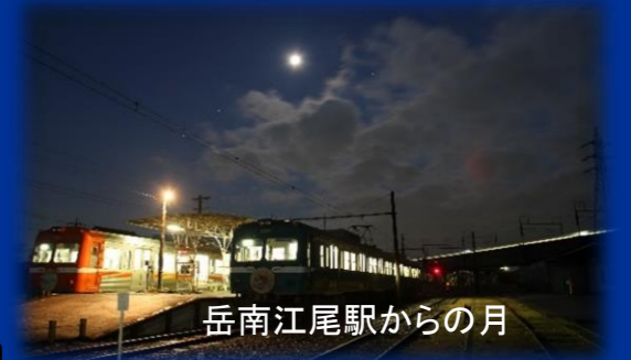
岳南江尾駅からの月

8000形電車の後方車両を消灯し、「日本夜景遺産」及び「日本百名月」に登録(鉄道として日本初)された岳南電車全長9.2キロの沿線に散りばめられた昭和の駅舎・車両・静寂な夜景・暗闇に包まれた工場の灯をノスタルジーに浸りながら約21分間の夜汽車の旅をお楽しみいただけます