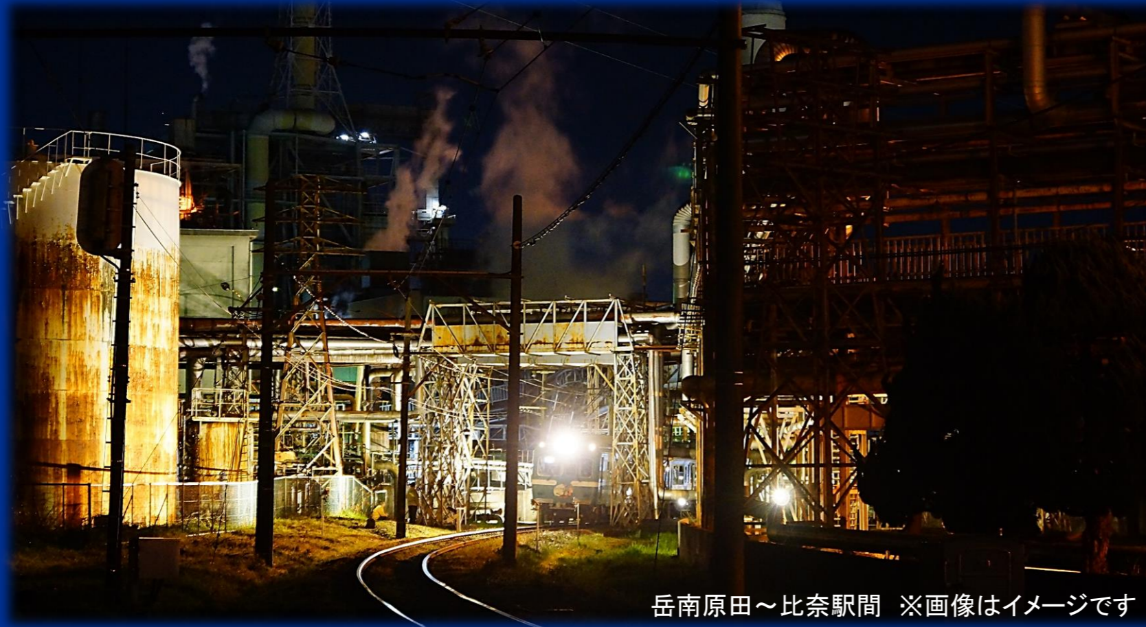
岳南原田～比奈駅間 ※画像はイメージです

車内では添乗員が見どころスポットの放送や案内、記念撮影のお手伝いなどをサポートいたします!