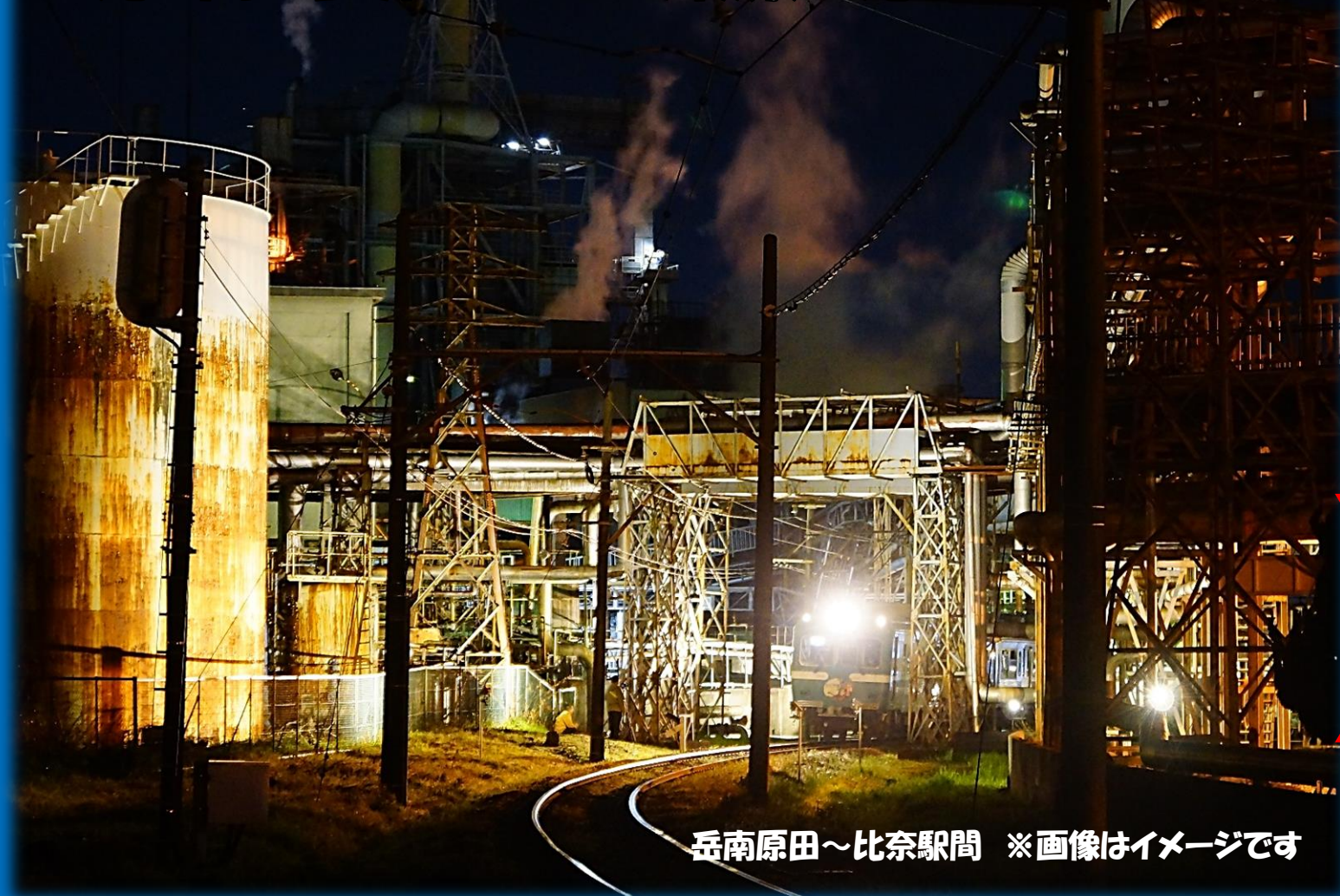
岳南原田～比奈駅間 ※画像はイメージです