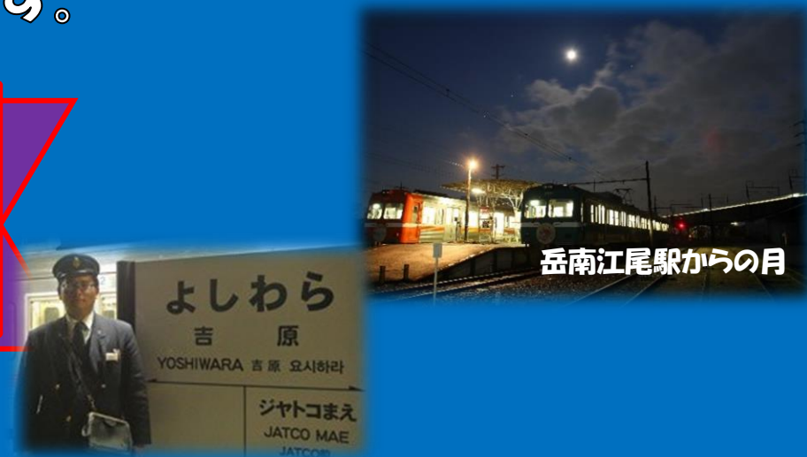
岳南江尾駅からの月

車内では添乗員が見どころスポットの放送や案内、記念撮影のお手伝い等をサポートいたします！