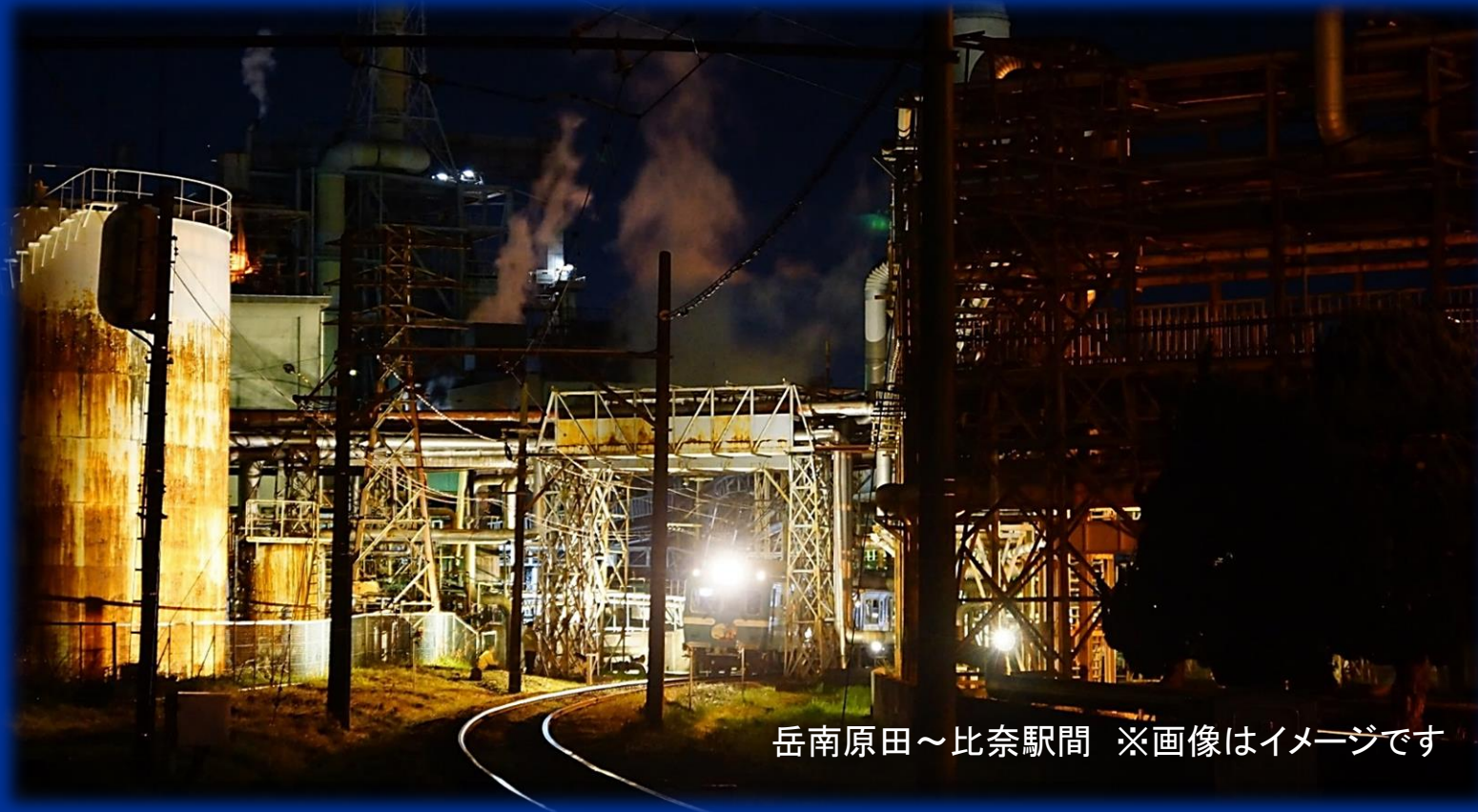
岳南原田～比奈駅間 ※画像はイメージです