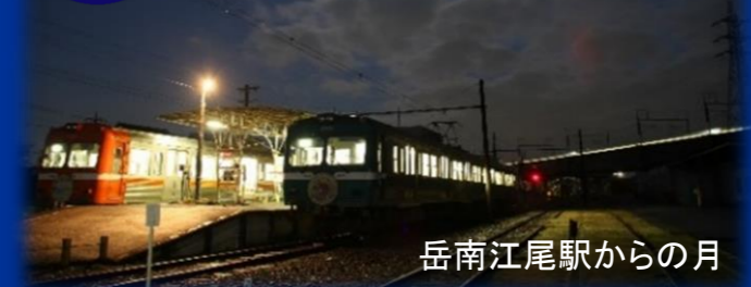
岳南江尾駅からの月