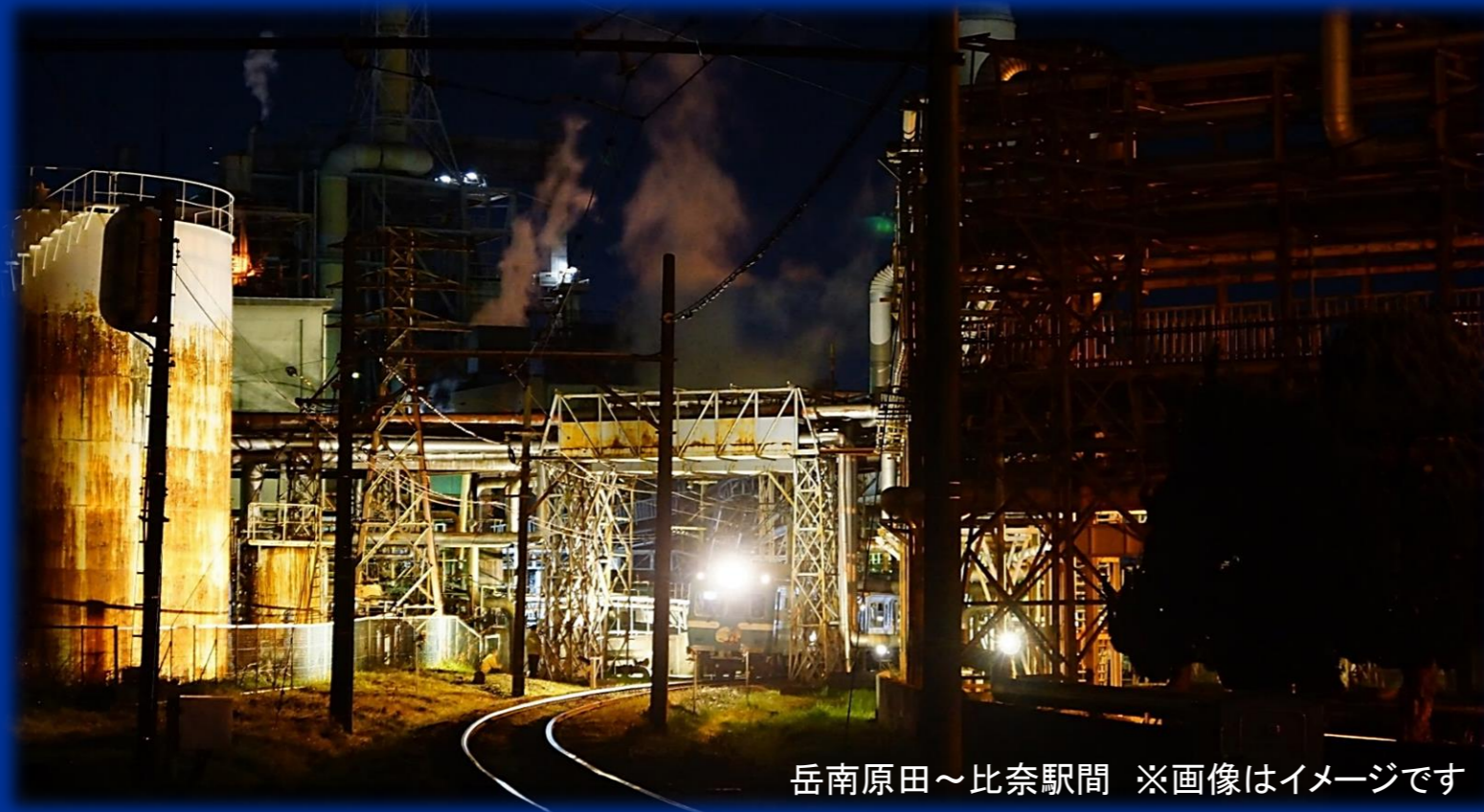
岳南原田～比奈駅間 ※画像はイメージです

2つのコンテンツに鉄道として日本で初めて登録されました。全長9.2キロの沿線に散りばめられた昭和の駅舎・車両・静寂な夜景・暗闇に包まれた工場の灯をノスタルジーに浸り、ゆったりとしたひとときにお月様を眺めておたのしみください。