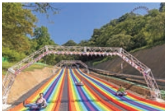
マジカルウェーブ

ご家族やご友人とともに、自然に囲まれた開放的なロケーションで、さがみ湖MORI MORIでしか味わえない爽快感と景色をぜひご体感ください。