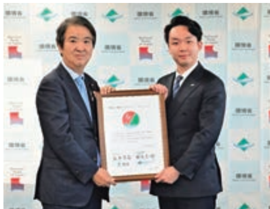
左：石原宏高環境大臣

今後も、地域の交通・観光インフラを担う事業者として、持続可能な観光地域づくりと自然環境保全の両立を目指し、国立公園の利用と保全が好循環する仕組みづくりに貢献してまいります。