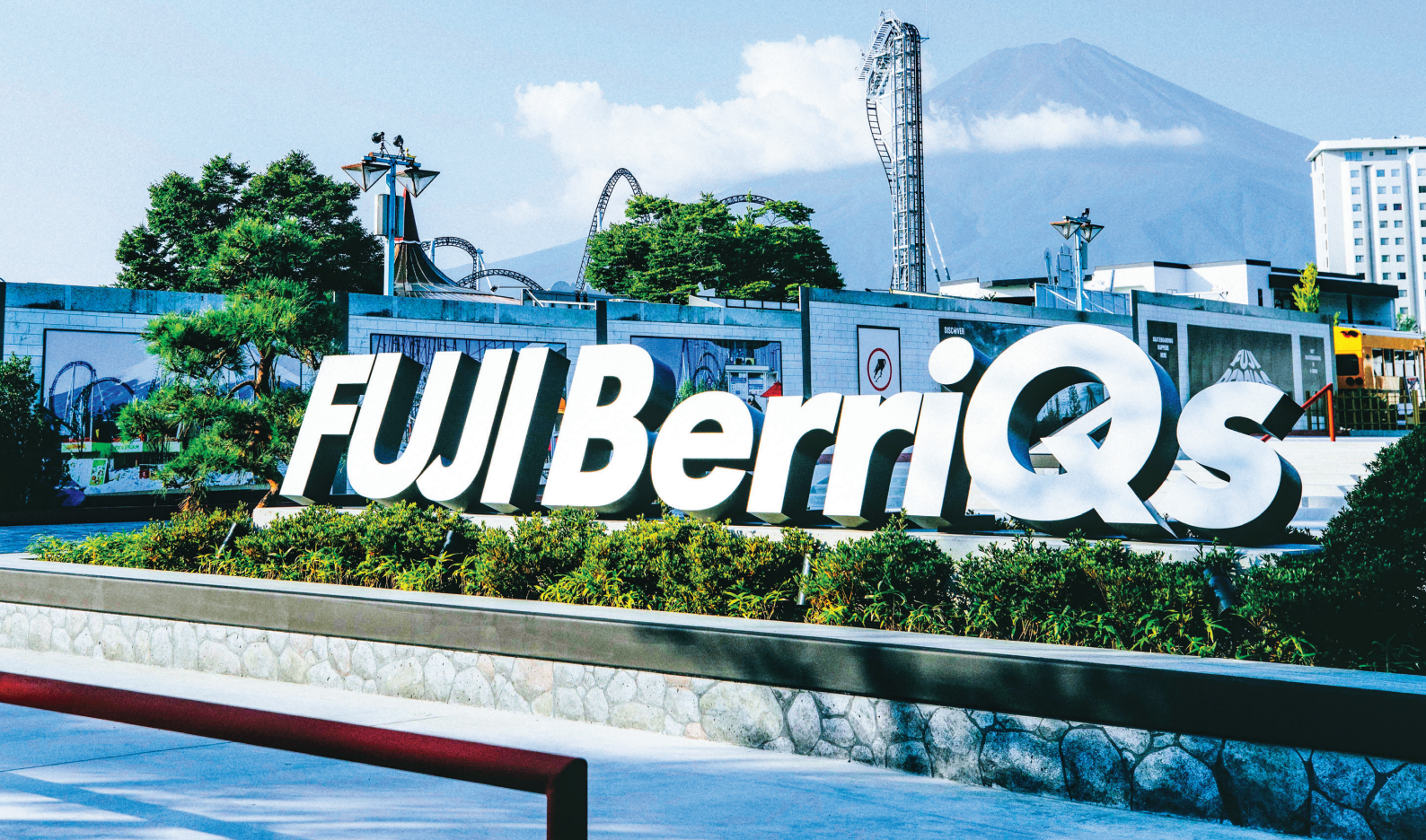
富士急ハイランド「FUJI BerriQs SKATE PLAZA」